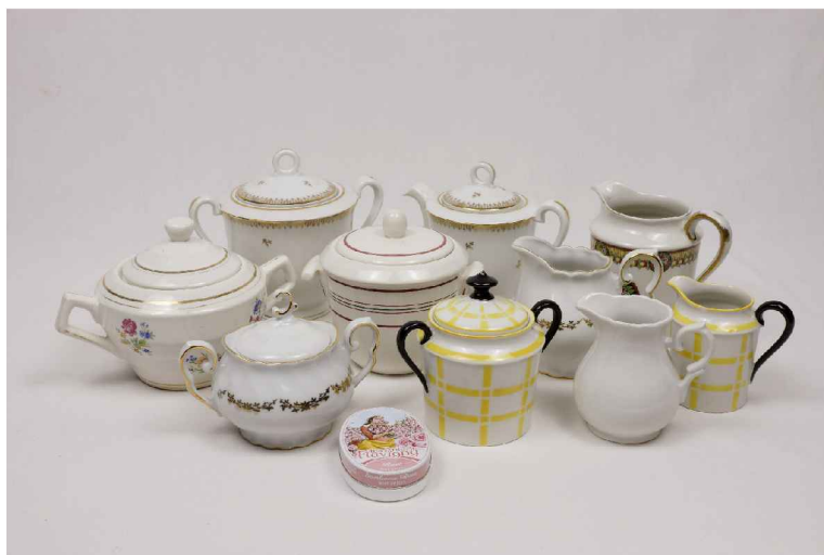
Le sucrier ou pot à lait : 3€

Surtout ne pas laisser en reste le pot à lait et le sucrier; avec ce petit détail vous remporterez à coup sûr la palme du bon goût.