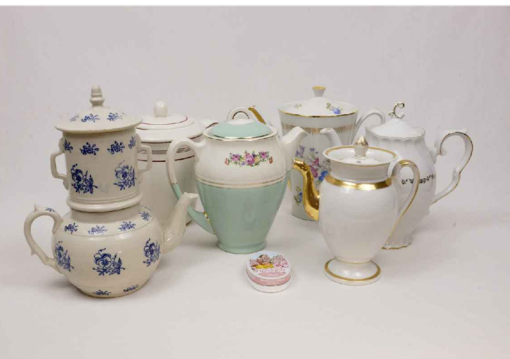
La cafetière : 4€

Quoi de plus raffiné que de servir café, thé ou infusion dans une cafetière en porcelaine? Le choix est à peine discutable.