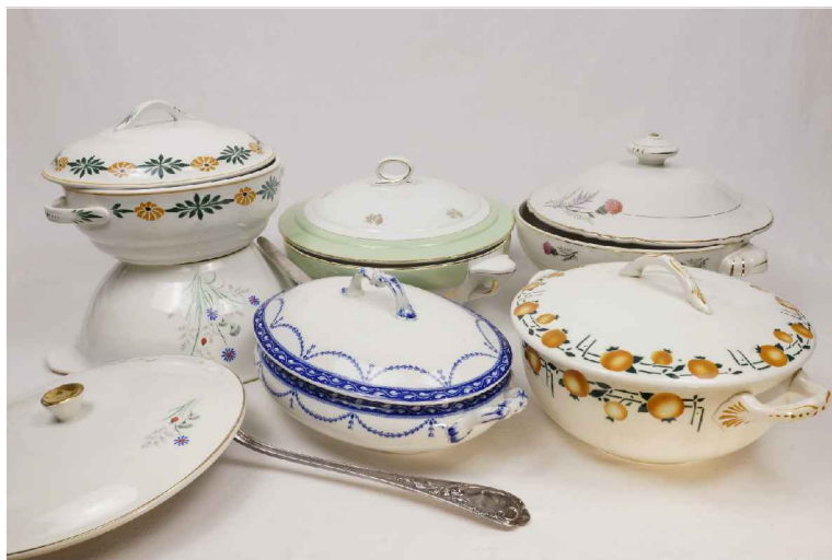
La souprière : 5€

Des soupieres pour servir la soupe à l'oignon ou la sangria, mais aussi pour servir les salades vertes ou des salades composées. Au choix.