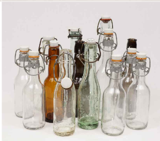
La petite carafe ou Le petit flacon apothicaire : 2,50€