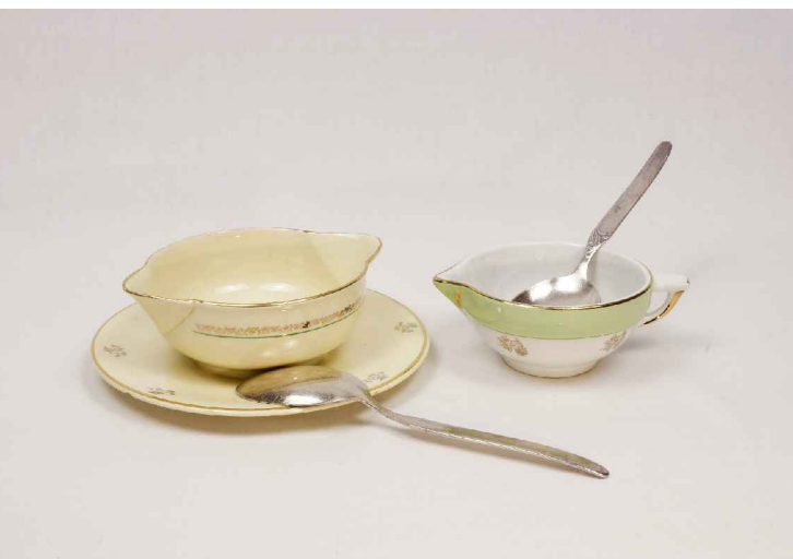
La saucière : 2,50€

Des saucières sous toutes leurs formes et aux décors assortis au service de table pour rendre l'ensemble harmonieux.